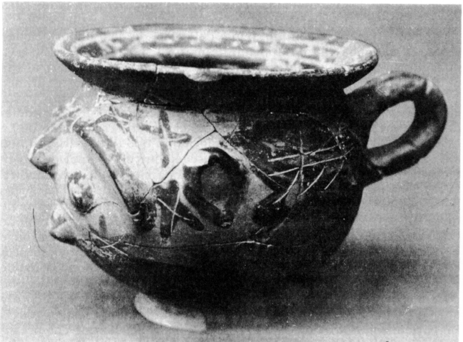
Lám. 3. - Copa imitación de las antropoprosopas de estilo etrusco corintio. Procede del estrato VIII, corte L5B de Ullastret, del Camp Alt d'en Sagrera. Se fecha a mediados del siglo -VI.